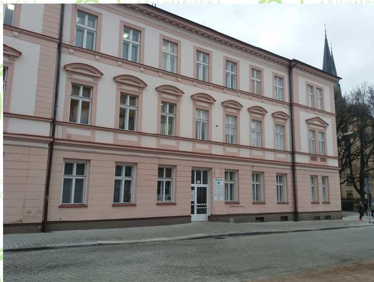
Budova Zdravotní střediska – 1.NP VZP