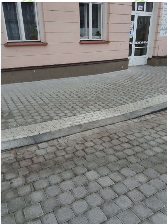
Přístup od vyhrazeného stání