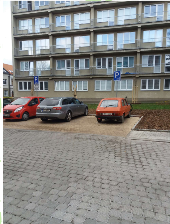
Vyhrazené stání 1x