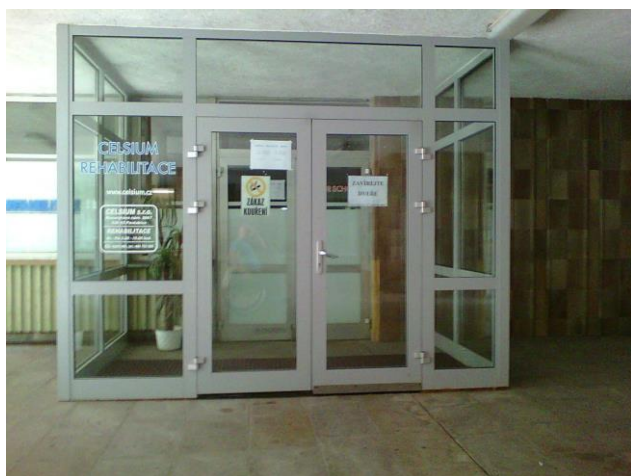
vstup CELSIUM REHABILITACE I.

Vstup CELSIUM s.r.o. REHABILITACE I. je pro vozíčkáře přístupný . Interiér je přístupný s dopomocí - nebezpečné.