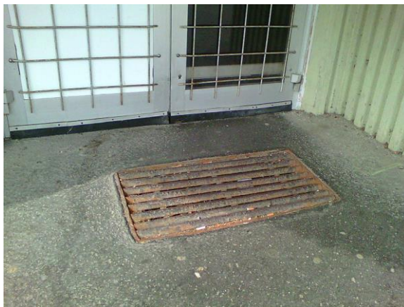
vstup do 1. PP polikliniky