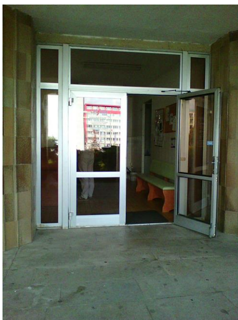
vstup REHABILITACE II.

Vstup CELSIUM s.r.o. REHABILITACE II. je pro vozíčkáře přístupný s dopomocí. Interiér je přístupný.