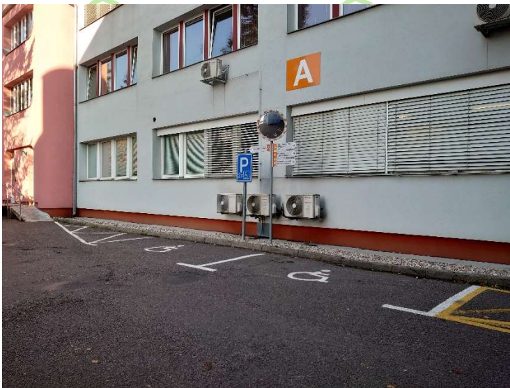
vyhrazené podélné stání pro ZTP 2x (před budovou A)