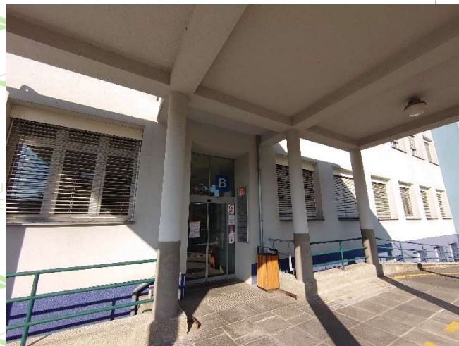
hlavní vstup do budovy A