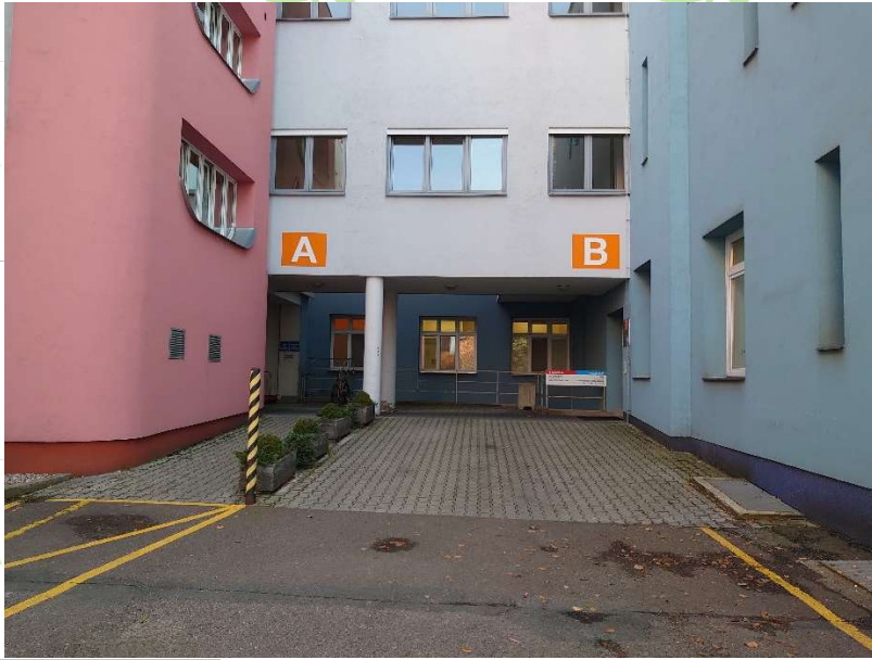
budova B (ze zadu)