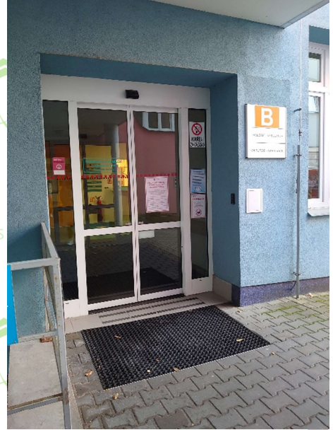
vedlejší vstup (ze zadu budovy)