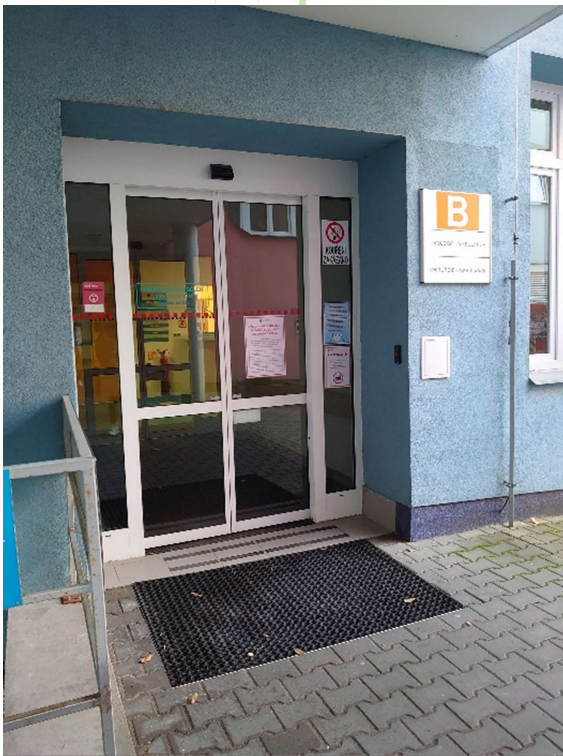
vedlejší vstup (ze zadu budovy)