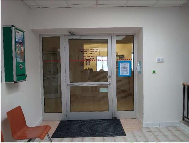
Traumatologie – lůžková část (4.NP)