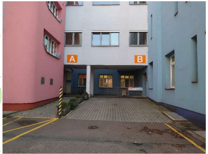
budova B (ze zadu)